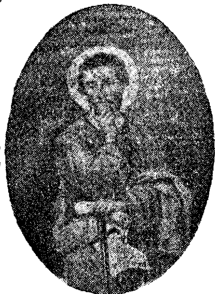
San Paolo, proteggi la Buona Stampa